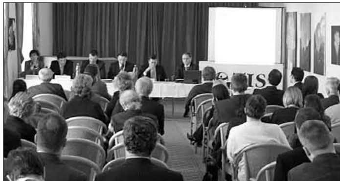
Seminára, na ktorom TIS prezentovala protikorupčné odporúčania pre novú vládu, sa zúčastnili zástupcovia 5 kandidujúcich politických strán a ich koalícií.