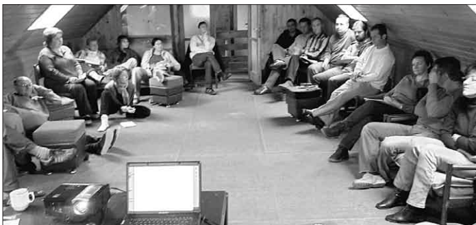
Každý rok na jeseň TIS organizuje seminár pre komunálnych poslancov s výraznou protikorupčnou profiláciou.

v samospráve. Seminár bol určený najmä poslancami obecných a mestských zastupiteľ-